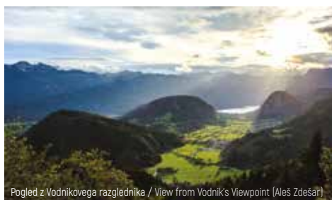
Pogled z Vodnikovega razglednika / View from Vodnik's Viewpoint (Aleš Zdesar)