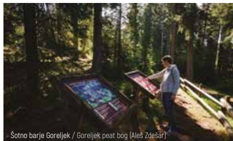
Šotno barje Goreljek / Goreljek peat bog (Aleš Zdešar)

Walking time: 2 hours (you can finish the trip at the Goreljek Bus Stop)