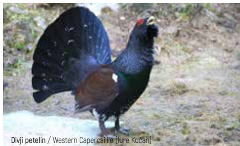
Divji petelin / Western Capercaillie (Jure Kočan)